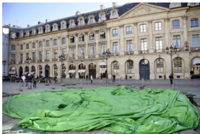
PHOTO : Après l'agression jeudi de l'artiste new-yorkais Paul McCarthy, lors de l'inauguration de sa sculpture gonflable, des inconnus s'en sont pris à "l'œuvre" dans la nuit de vendredi à samedi. Elle ne sera pas réinstallée.

ce n'est pas dans les ressorts de la finance qu'il faut aller rechercher le « secret » qui a fait déguerpir en catastrophe McCarthy, mais dans ceux de l'Art royal de la Politique, c'est-à-dire dans la relation symbolique articulant l'Art et la Politique !