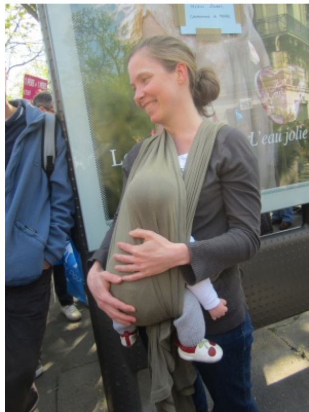
Photo : Le bonheur de la mère à l'enfant. Manifestation pour tous du 21 avril 2103.

4— À l'évidence, cette Manifestation de la Vérité, incarnée par la « manif pour tous », est la revanche de la femme sur les féministes et sur un État sectaire et sexiste qualifiant ignominieusement les femmes au foyer de « sans emploi » !