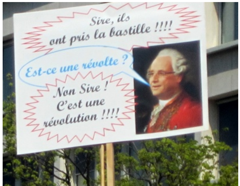
Photo : La tête du président Hollande au bout d'une perche dans la "Manifestation-pour-tous" du 21 avril 2013.

La Révolution est dans la rue. Deux jours avant le vote, la manifestation monstre du Dimanche 21 avril s'est ouverte sur l'image symbolique de la tête du Président Hollande emperruqué au bout d'une « perche ».