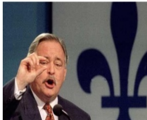
Photo : Référendum de 1995 : Jacques Parizeau, premier ministre, explique la courte victoire du Non devant la foule attristée.

Une telle grille de lecture rend dérisoire les querelles de clochers ou de boutiques. Tel le fait qu'il n'ait manqué que et 54 288 voix, soit à peine un pourcentage de 0,58 % au référendum de 1995 sur la souveraineté au Québec pour passer.