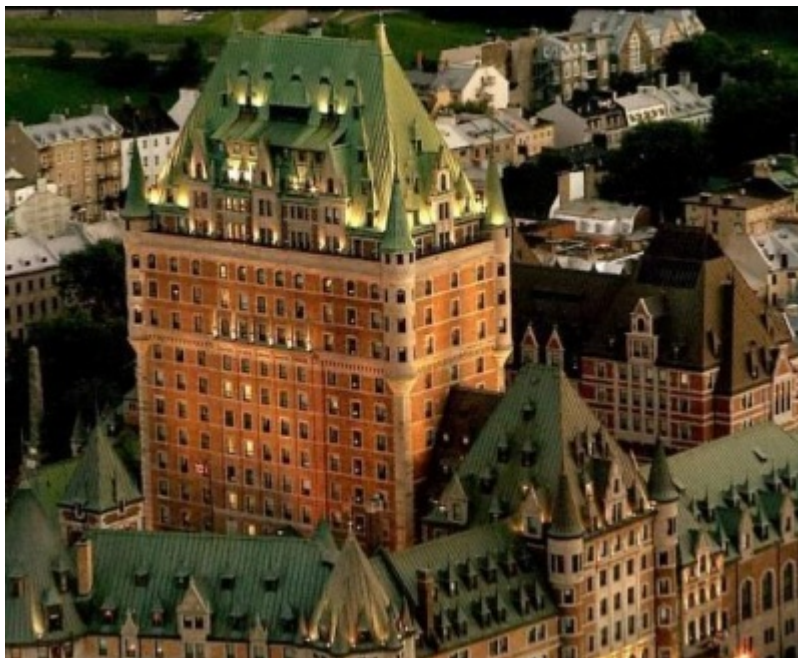
Photo : Québec, l'Hôtel-Château Frontenac, de style médiéval.

Le Québec est le dernier témoin de la Nouvelle France, cet immense territoire d'Amérique du Nord allant jadis de l'embouchure du fleuve Saint-Laurent au delta du fleuve Mississipi en passant par la vallée de l'Ohio.