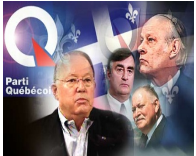
Photo : Les ténors de l'indépendance, couvrant deux référendums, de 1976 à 1995 : les 4 premiers ministres, René Lévesque, Lucien Bouchard, Bernard Landry et Jacques Parizeau.

"Notre rencontre rend manifeste le fait que l'importance de la mission civilisatrice du Québec en Amérique et de par le monde ne saurait être ou ne plus être, au vu de ces faits historiques et ces principes universels, tel est le destin du Québec, corps sans tête politique :