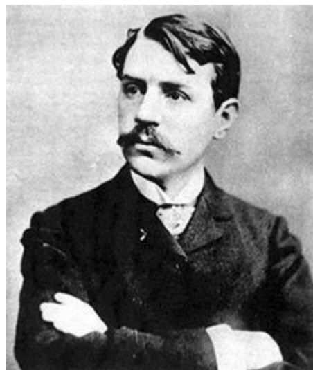
Photo : Paul Bourget, écrivain français, (1832-1935).

3 - JOURNAL QUÉBEC PRESSE : Il semble qu'une majorité d'Académiciens (les 40 immortels) souhaitent l'indépendance du Québec. Qu'en pensez-vous ?