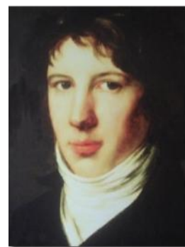
Photo : Louis-Antoine de Saint-Just, né en 1767 et guillotiné à 27 ans, célèbre révolutionnaire, député de l'Aisne à 25 ans, président de la Convention Nationale, artisan de la victoire de Fleurus.

LA LOI DU TYRAN : « UN PEUPLE N'A QU'UN ENNEMI DANGEREUX, C'EST SON GOUVERNEMENT ! » (SAINT-JUST)