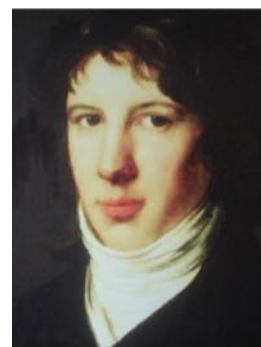
Photo : Louis-Antoine de Saint-Just, né en 1767 et guillotiné à 27 ans, célèbre révolutionnaire, député de l'Aisne à 25 ans, président de la Convention Nationale, artisan de la victoire de Fleurus.

LA LOI DU TYRAN : « UN PEUPLE N'A QU'UN ENNEMI DANGEREUX, C'EST SON GOUVERNEMENT ! » (SAINT-JUST)