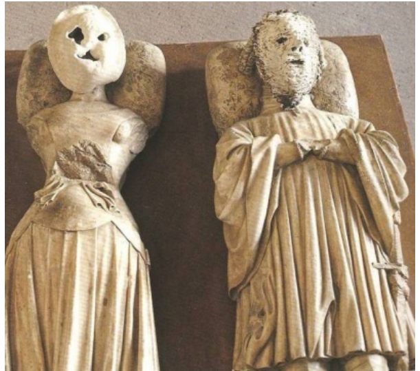
Photo : Les masques de dérision furent retirés des gisants d'Anne de Bretagne et de Louis II, duc de Bourbon. Photo tirée de la revue Connaissance des Arts , avec cette légende: "Miquel Barcelo, masque de moi-même à un très jeune âge, et masque avec un Nez Pointu, 1999, céramiques sur des gisants d'anne de Pretagne et de Louis II, duc de Bourbon.

(Voir La Provence du 28 juillet 2010 et 2 http://coordination-defense-de-versailles.info/ )