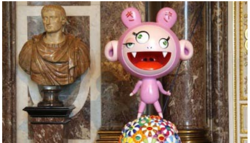
Photo : Versailles, Murakami expose la frénésie de l'outrance : le cri de l'art contemporain perçant l'esprit sublimé de Louis XIV.

C'est en ces termes que la Coordination Défense de Versailles adresse une lettre ouverte à l'Empereur japonais.