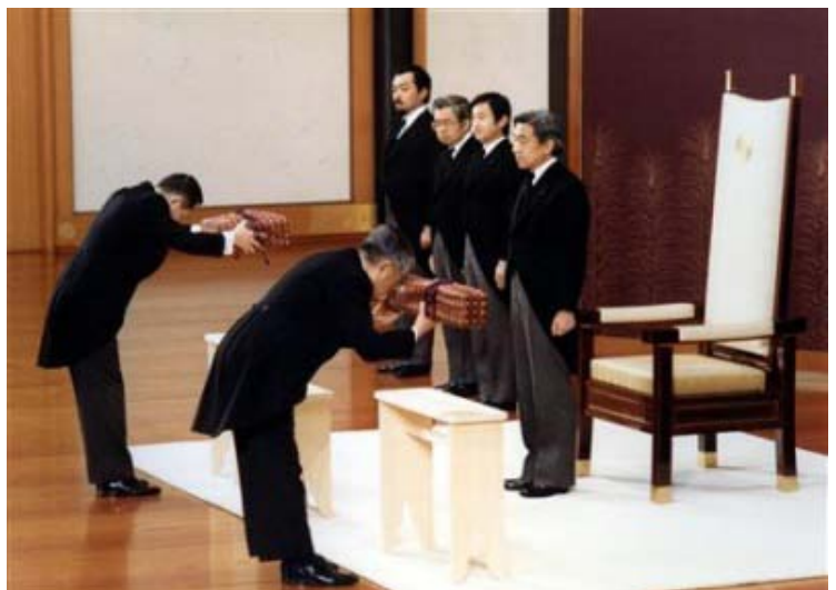
Photo : L'empereur Hiro Hito meurt le 7 janvier 1989 à 6h33. Et trois heures plus tard au Palais impérial de Tokyo, le Premier Ministre apporte les trois trésors sacrés au prince héritier Akihito ainsi que le sceau privé. Akihito devient Empereur. C'est le début de l'ère Heisei.

Répondant à notre appel au combat, contre un ennemi culturel commun, les Japonais ont alors téléphoné en masse à l'Ambassade de France pour y présenter leurs excuses.