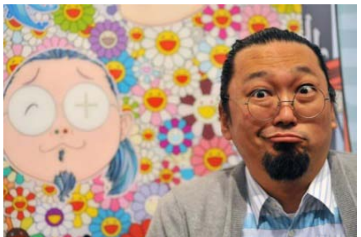
Photo : La saveur du réel chez Murakami passe par le dérisoire dans l'ampleur du possible... jusqu'à l'attaque de Versailles !