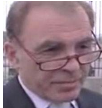
Photo : Arnaud-Aaron Upinsky, président de l'Union Nationale des Écrivains de France.

Sa Majesté l'Empereur du Japon, Monsieur le Premier ministre Naoto Kan Le Peuple japonais Le Grand Sénéchal de l'Agence impériale Palais Impérial, Tokyo