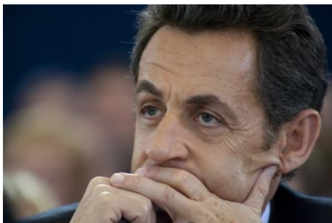
Photo : Le président Nicolas Sarkozy se heurte aux résistances de plus en plus nombreuses.