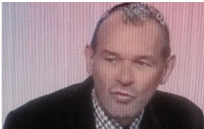
Photo : Jean-Jacques Aillagon Conservateur du Château de Versailles, dans un face-à-face au Figaro avec Philippe Tesson.

désavouer celui qui joue au Roi-soleil aux dépens de la France et obtenir la démission de M. Aillagon que nous sollicitons par cette lettre.