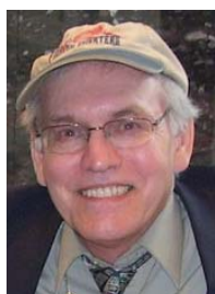
Michel CLOUTIER Journal Québec Presse VERSAILLES — Le vendredi 1er octobre 2010

Par une volonté aussi sérieuse que passionnée, c'est l'offensive contre "l'imposture" d'artistes américains new-yorkais qui bafouent l'esprit royal de Versailles en y exposant leurs œuvres contemporaines, dénonce-t-on.