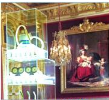
Femme-Aspirateur de Jeff Koons

2008. C'est une déclaration de guerre « hétérophobe » ciblée à l'Art que JJ. Aillagon lance, en prétendant marier Jeff Koons et Versailles, alors qu'il s'agit d'un viol .