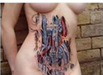
Femme-Machine à ovocytes. GPA. PMA. ..

Depuis le divorce en 1884 , l'invention des mots homosexualité (1891) et hétérosexualité (1894), la montée du Pouvoir homosexuel n'avait cessé de progresser dans l'art, les médias, la mode, l'espace public, etc. D'abord « défensif » par abolition du pouvoir paternel (1970), dépénalisation de l'homosexualité (1982) et Pacs (1999). Puis « hétérophobe » et « misogynne », avec déclaration de guerre « offensive » , par pénalisation des « propos homophobes » (2003), Négation des sexes à l'école (Gender, 2011), suppression des cases « Mademoiselle » et « nom de jeune fille » des formulaires administratifs (févr. 2012) ; plan de déconstruction du modèle féminin à l'École, sous couvert du mot travesti de « stéréotype » (nov. 2012).