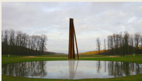
Neuf lignes obliques – Domaine de Marly-Le-Roi