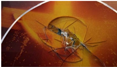
La photographie intitulée 'Pis Christ' détruite à la Collection Lambert à Avignon.

❑ 2 ÈME SIGNATURE : VANDALISME HYSTERIQUE DES MEDIA