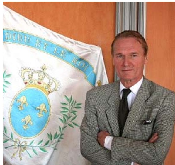
Photo: Le Prince Sixte-Henri de Bourbon